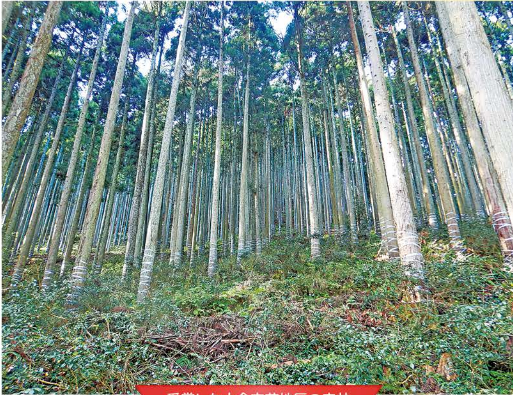
受賞した十倉志茂地区の森林

組合員の皆様にご報告させていただきますとともに、今回の受賞を励みとして、今後一層綾部の豊かな森づくりに取り組んでまいります。