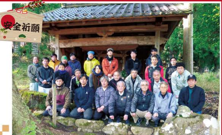
令和5年12月8日 山の神参拝 (於 睦寄町)

当日は地元の役員の方も一緒に参拝していただき、組合長、職員、作業員合計23名が、日頃山で仕事をさせていただいていることへの感謝と、今後の作業の安全を山の神さまに祈願しました。