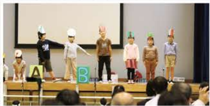
▲体を使って人工林を表現