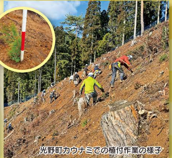
光野町カウナミでの植付作業の様子