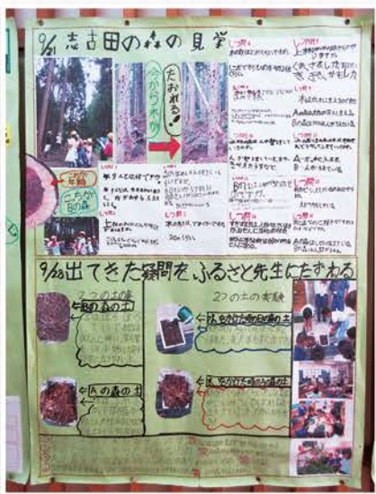
▲林業見学で学習した内容をまとめた展示がありました！力作です！