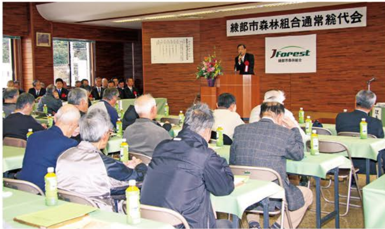
山崎市長来賓ごあいさつ