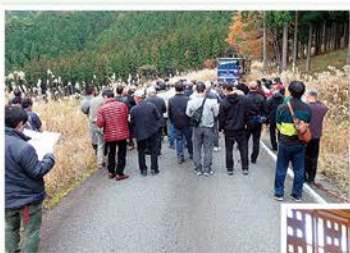
水源林造林地視察

夜には、今回の宿泊先であります鳥取県のはわい温泉「望湖楼」にて懇親会が開かれ、他の森林組合さん、企業体の方々と懇親を深め、とても勉強になった二日間の視察研修でありました。