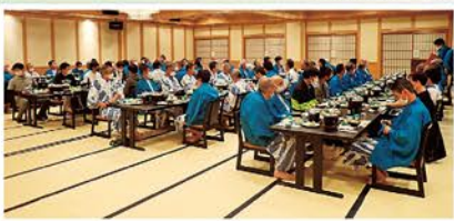
参加者全員による懇親会