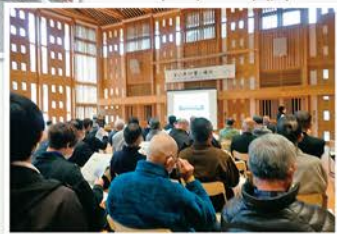
西栗倉村「百年の森林事業」研修