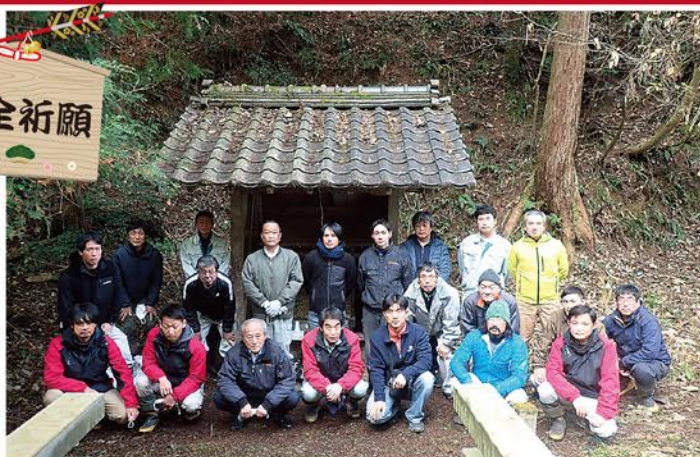
令和4年12月9日 山の神参拝 (於 十倉志茂町)

今回、十倉志茂地区で間伐等の作業をお世話になっていることもあって、地元の了解を得て、組合長、職員、作業員の22名が、日頃山で仕事をさせてもらう感謝と、職員、作業員の安全を山の神さまに祈願致しました。