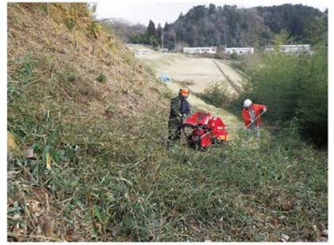
▲刈り終えた竹や雑木はチッパーで粉砕し、防草対策として道にまきます