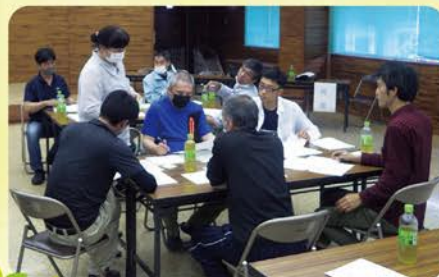
▲グループワークの様子