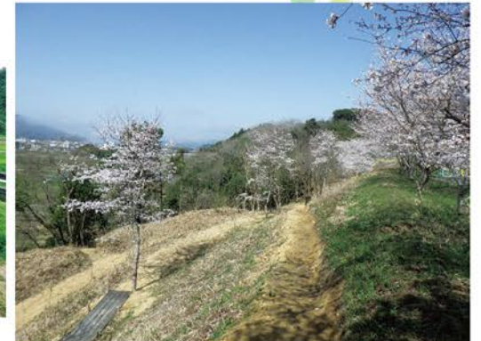
▲4月初旬には、桜が満開です。