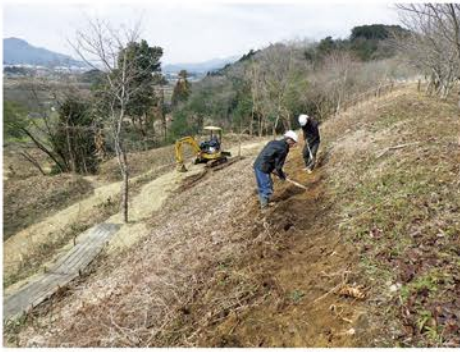
▲手掘りで道をつけています。(後で重機も使用しました)