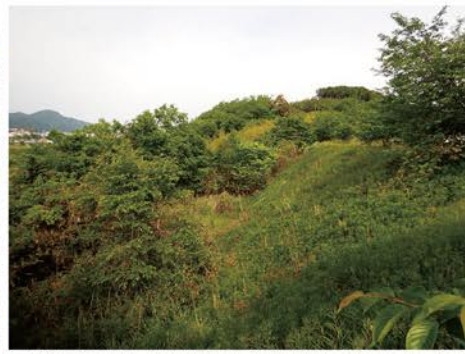
▲作業前の様子:草や雑木などが生い茂っています