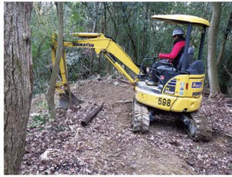
▲重機を使用し森の中に道をつけます。