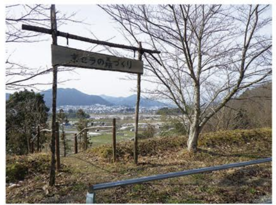
▲社員の方々が手づくりされた入口の看板