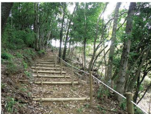
▲階段、手すりを設置しました