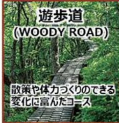
散策や体力づくりのできる変化に富んだコース