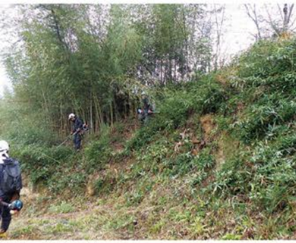
刈払い作業の様子