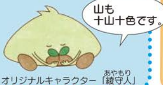
オリジナルキャラクター「あやもり（綾守人）」