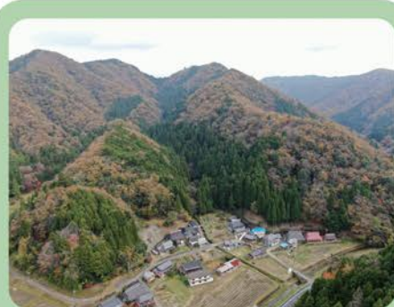
今回整備する水梨集落の森林の様子（令和4年度撮影）