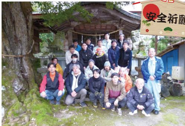
令和6年12月9日 山の神さま参拝 (於 日吉神社)

当日は、組合長、職員、林業技術員合計21名が、日頃山で仕事をさせていただいていることへの感謝と、今後の作業の安全を山の神さまに祈願しました。