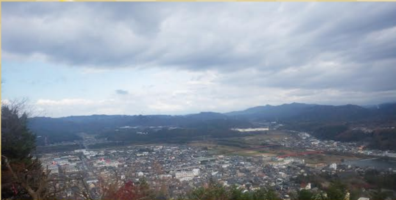
▲樹木伐採後の藤山公園から撮影