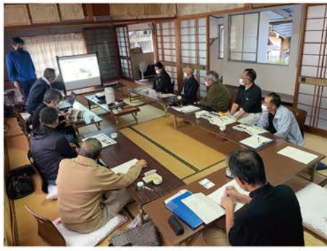
▲地元説明会の様子