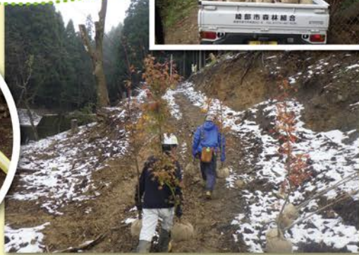
▲広葉樹を現場まで