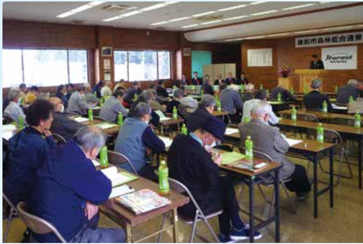
▲多数の総代様の出席により開催しました