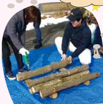
園児さんに見守られながら先生が穴開け