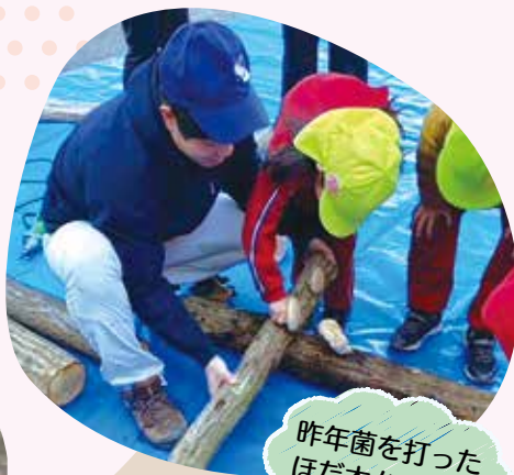
昨年菌を打ったほだ木から収穫

2月10日に吉美こども園、同月18日に綾東こども園で菌打ち体験を実施しました。今年にはコマ菌の打ち込みのほか、原木への穴開けを、先生方や園児さんに体験していただきました。楽しんでもらえるか、うまく進行できるかという不安は、ワクワク顔の園児さんを前にすると吹き飛び、体験の時間が終わるのを残念に感じるほどでした。体験後の片付けやほだ木運びのお手伝いも楽しんでくれました。 体験を通じ、新しい発見があり、楽しく実りの多い時間になりました。ご協力いただいた先生方、ありがとうございました。