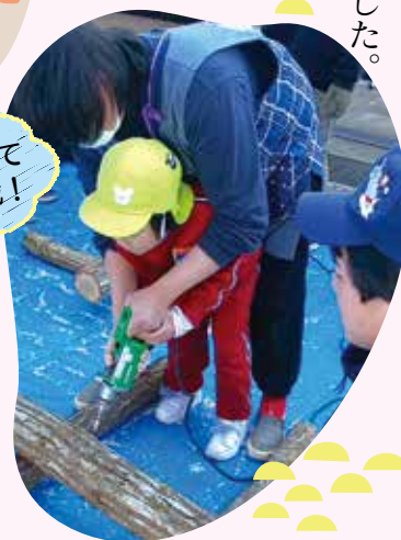
先生に手伝ってもらって挑戦!