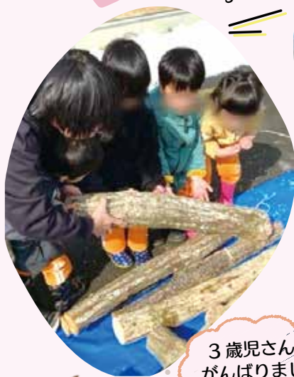
3歳児さんもうがんばりました